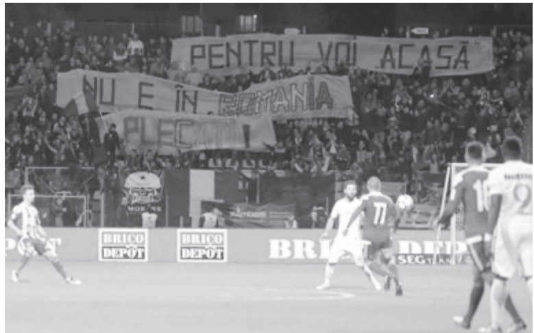
A Sepsi OSK és a Bukaresti FCSB október elsejei, Brassóban rendezett mérkőzésén a bukaresti csapat szurkolóinak egy csoportja óriásmolnót feszített ki azzal a felirattal, hogy „Nektek Románia nem az otthonotok! Menjetekek innen!”

A román labdarúgásban azóta erősödtek fel a lelátói magyarellenesség megnyilvánulásai, hogy a 2017–2018-as idényben az 1. ligában játszik a Sepsiszentgyörgyi Sepsi OSK, amelynek a játékoskeretét ugyan zömében román nemzetiségű játékosok alkotják, de a székelyföldi szurkolók általában magyarul biztatják a csapatot.