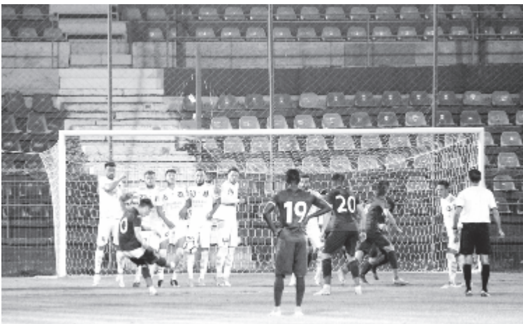
Az utolsónak tekinthető mérkőzésen is üresen maradt széksorok előtt játszottak.

A találkozó után senkit nem sikerült szóra bírunk az ASA együttesétől, de a csapattal kapcsolatos fejleményekre rövidesen visszatérünk.