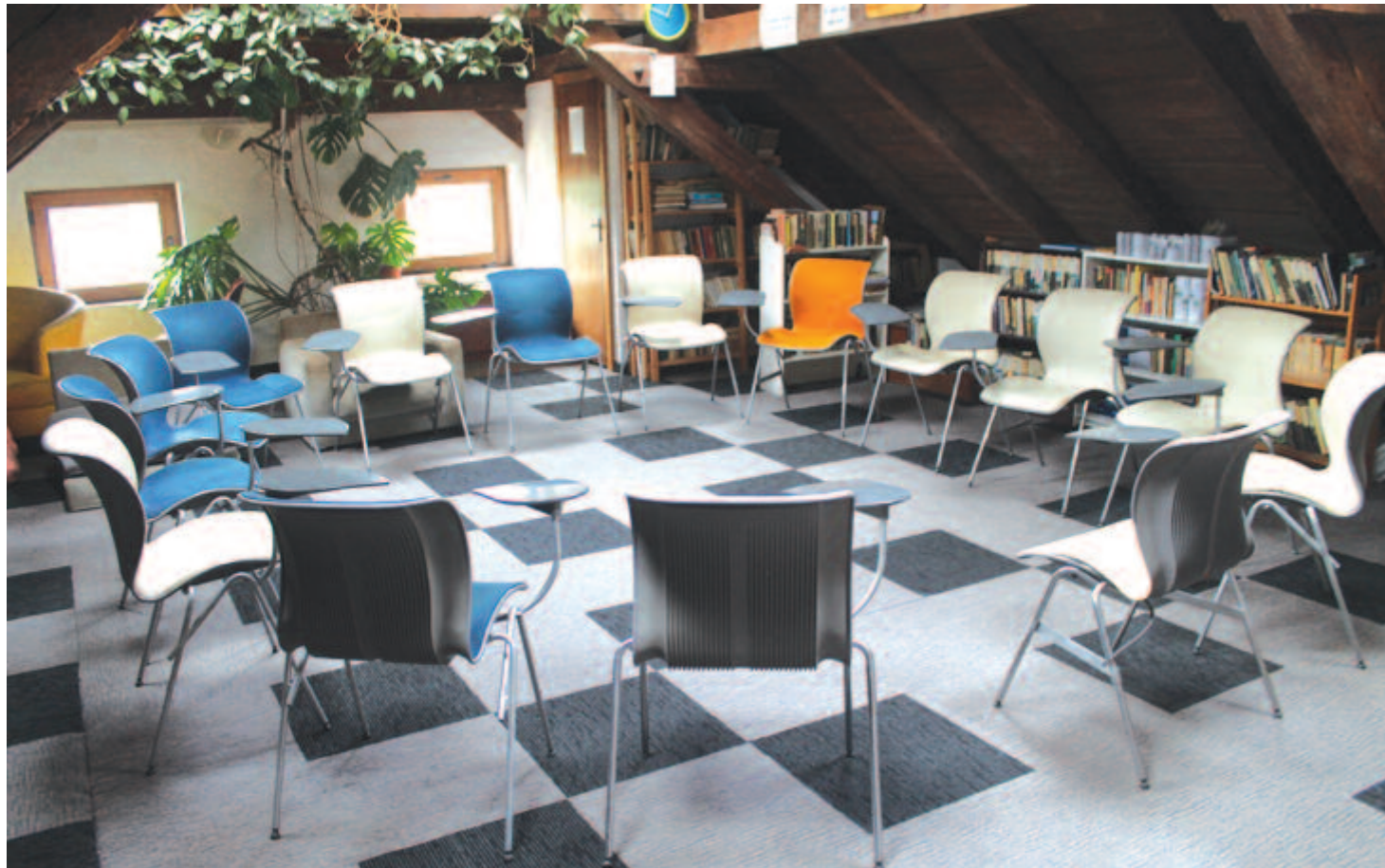
A csoportos terápiák helyszíne

szolgálatnak, amelyet igény szerint használhatnak a lakók, és egy-két szobába is benyitott. Pedáns rend fogadott a kétágyas helyiségekben, és a ruhásszekrényre kifüggesztett, szintén terápiás jellegű minősítések arról árulkodtak, hogy ez nem csak látogató-