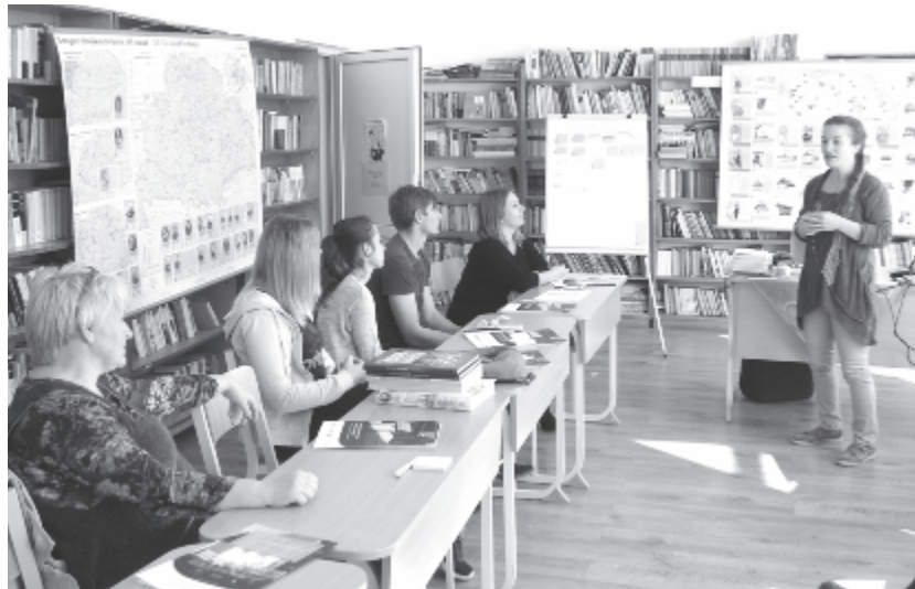
Első lépésben a helyi természeti értékeket azonosítják