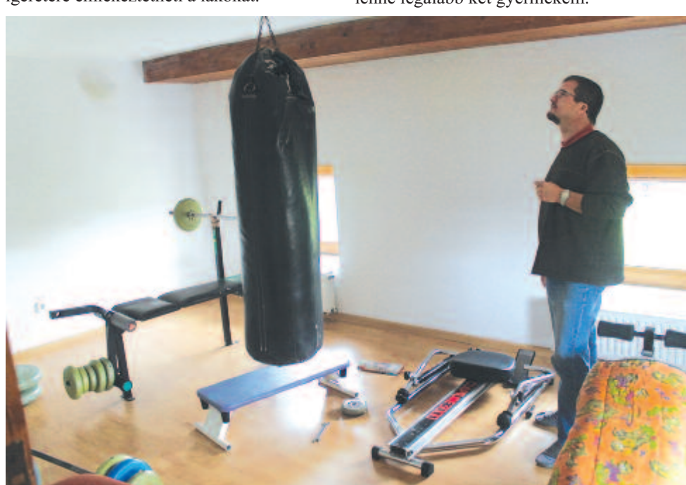
... és az edzőtermet

sunk idején van így. Az egyik szobában az ablak fölött elhelyezett angyalhaj ragadta meg a figyelmemet. Október elején is beleillett a képbe ez a karácsonyi jelkép, amely ébredés-kor és lefekvés-kor is a születés, újjászületés ígéretére emlékeztetheti a lakókat.